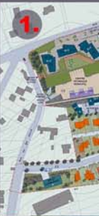
PROJET D'AMENAGEMENT ET DE DEVELOPPEMENT